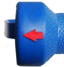
De Rode pijl